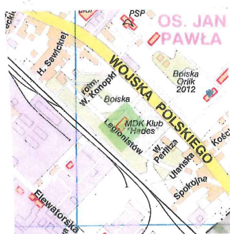
SZKIC ORIENTACJI SKALA 1 : 10000

[Podpis] Starosta miejscowość i data imię i nazwisko, podpis, funkcja Wydziału Naczelny Wydział Geodezji i Kartografii